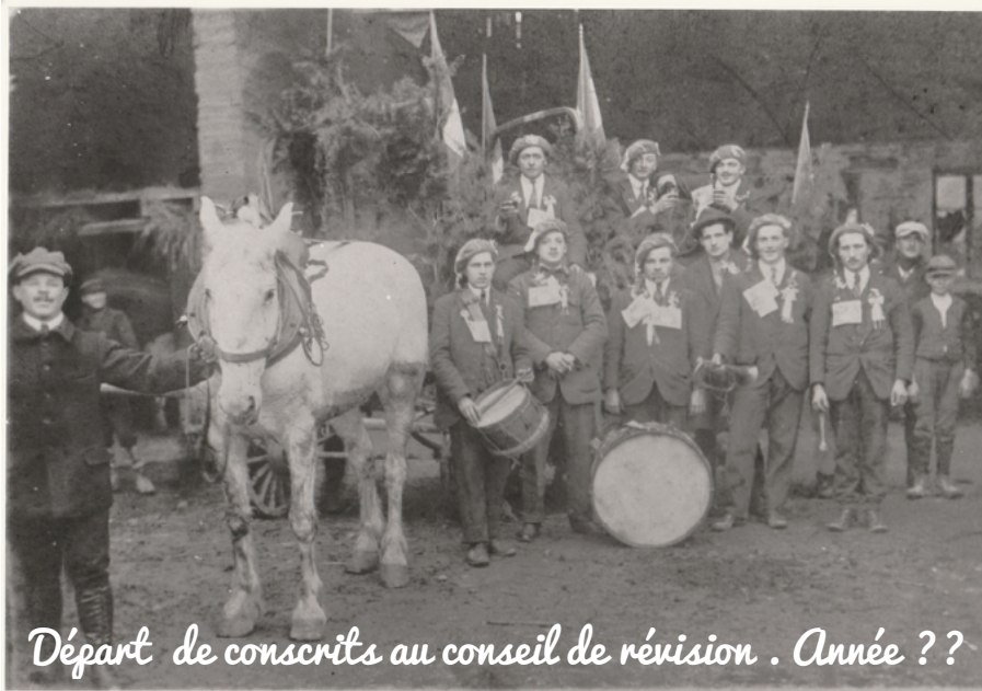
Départ de conscrits au conseil de révision . Année ??