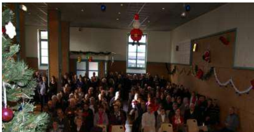
Vœux de la Municipalité, dimanche 4 janvier 2015

Le Conseil Municipal et moi-même vous souhaitons une très bonne année 2015.